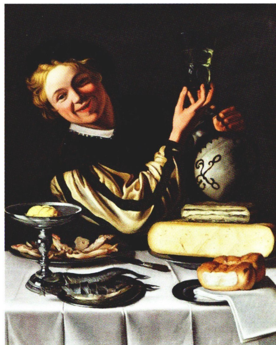
Keuken, schilderij van Corstiaen Couwenbergh.

Vader Gilles was eigenaar van het pand Het Vliedend Paert. Ten bewijze daarvan lagen in huis nog acht oude koopbrieven van de vorige eigenaren, waarvan de oudste dateerde van 13 okt 1559. Op het huis rustte een opstal op (erfpacht) van twee pond hollands 's jaars en er moest jaarlijks nog een halve stuiver 'gravenhuur' betaald worden. Dat laatste was een