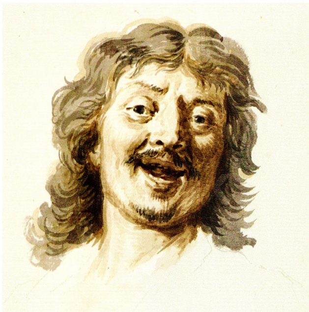
Corstiaen van Couwenburch.